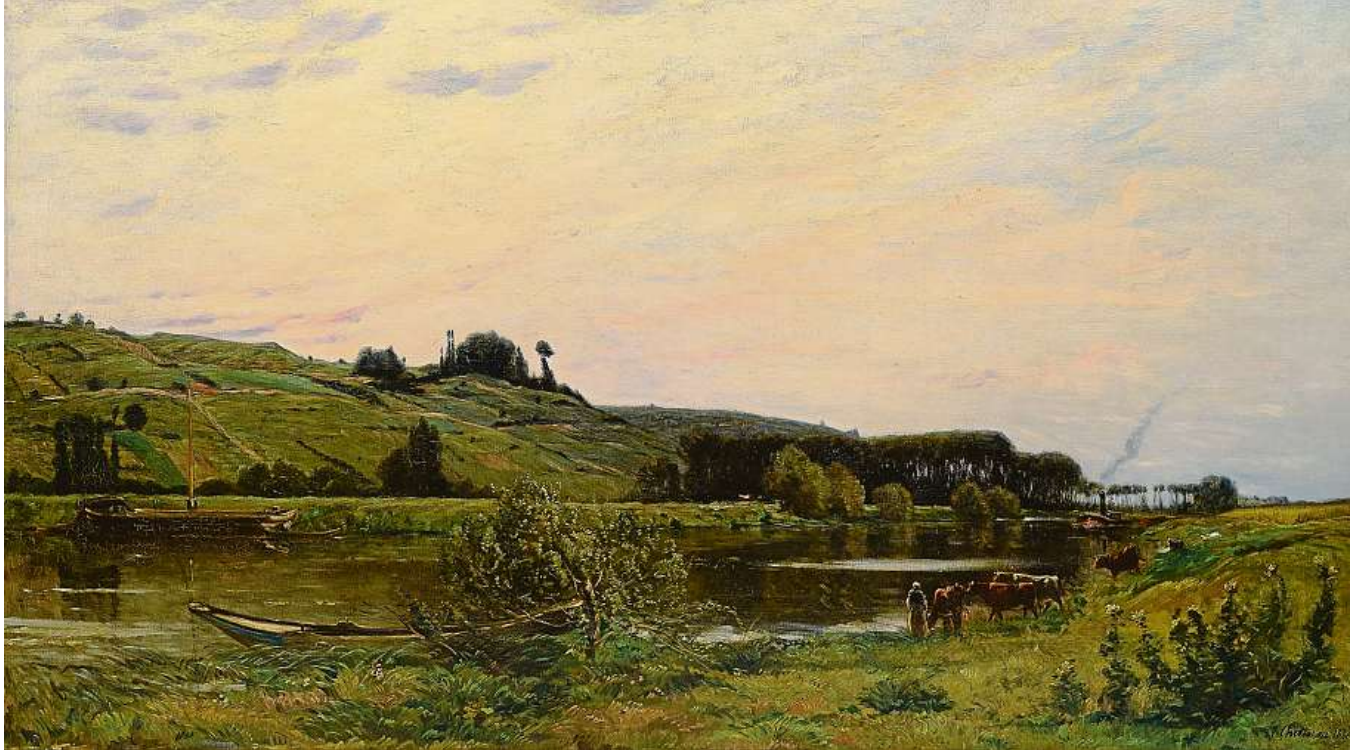
FRANCOUZSKÁ MONUMENTÁLNÍ KRAJINA OBRAZ OD ANTONÍNA CHITTUSSIHO S VYVOLÁVACÍ CENOU JEDEN A PŮL MILIONU KORUN. AUTOR DÍLA JE POVAŽOVÁN ZA JEDNOHO Z NEJSLAVNĚJŠÍCH ČESKÝCH MALÍŘŮ 19. STOLETÍ. PRODEJNÍ ODHAD OBRAZU JE PŘES TŘI MILIONY KORUN.