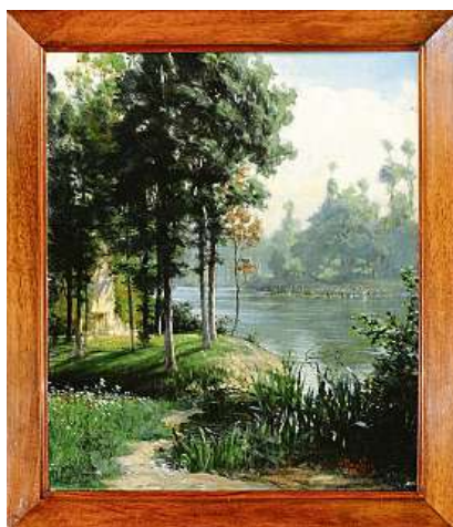
NA BŘEHU ŘEKY MARNY OLEJ FRANTIŠKA KUPKY Z ROKU 1894.

Další dílo Toyen „Jarmark“ bylo druhým nejdražším a kupující jej pořídil za 30,2 milionu. „Stále více zámožných lidí vnímá, že umění patří k životu, že je třeba je chránit a podporovat. Někteří