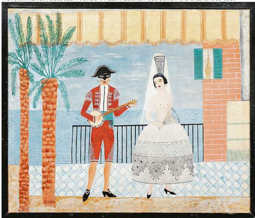
SERENÁDA VRCHOLNÝ OBRAZ MALÍŘKY TOYEN Z LET 1924-1925 PATŘÍ K NEJŽÁDANĚJŠÍM DÍLŮM AUTORKY. ZACHYCUJE JEJÍ TVORBU V MEZIVÁLEČNÉM OBDOBÍ.