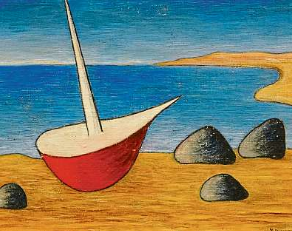
OSIŘELÁ BÁRKA OBRAZ JANA ZRZAVÉHO DRAŽÍ GALERIE PLATÝZ ONLINE. AUKCE KONČÍ 15. LISTOPADU.