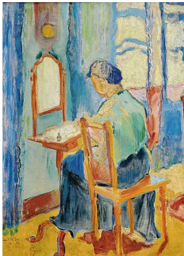
U ZRCADLA DÍLO EMILA FILLY Z ROKU 1907.