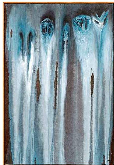
DÝCHÁNÍ SPÁNKU SURREALISTICKÉ DÍLO DRAŽENÉ GALERIÍ ADOLF LOOS NAMALOVALA TOYEN V ROCE 1958.

Další lákavou položkou aukce bude raná olejomalba Na břehu Marny z roku 1895 od Františka Kupky. Pozornost sběratelů jistě přitáhne i nádherný obraz od Jana Preislera Milenci v lese z roku 1906, jenž pochází z významné kolekce obrazů ze sbírky bratrů Duškových.