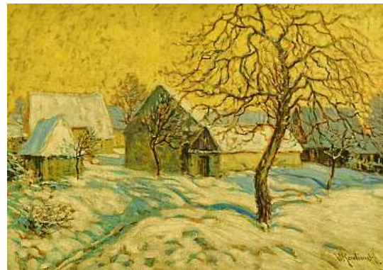
ZIMA V NORMANDII OBRAZ VÁCLAVA RADIMSKÉHO VSTOUPIL DO DRAŽBY S VYVOLÁVACÍ CENOU 60 TISÍC KORUN.