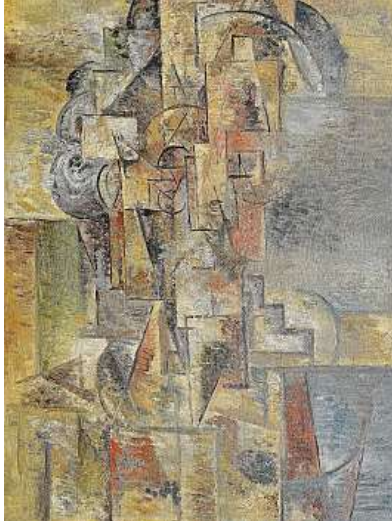
FILLŮV STARÝ MUŽ OBRAZ EMILA FILLY HLAVA STARÉHO MUŽE DRAŽÍ GALERIE KODL S VYVOLÁVACÍ CENOU OSM MILIONŮ KORUN.

Myslím, že pokladů je v soukromých sbírkách ještě hodně, a těším se na ně nejen z hlediska obchodu, ale i z toho odborného, protože některé obrazy mohou zásadně přispět ke znalosti díla daného umělce. Vzpomínám, když jsme v malé světničce staropražského domu, ve slabém