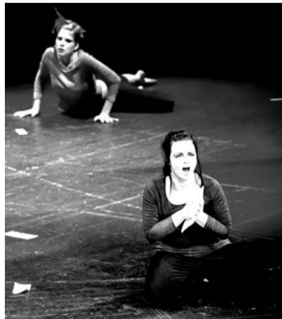
Ponava (Zmizelá řeka) si udržet tvůrčí energii, dětsky opravdový pohled na svět.

Většina představení se hraje v tradičních operních domech – v Národním a Stavovském divadle, ve Státní opeře, ale festival expanduje i na scény, kde bychom asi operu nečekali: do La Fabriky, Divadla Komédie, Českého muzea hudby či Divadla Hybernie. Představí se tu mladší a střední generace českých skladatelů, jejichž divadelní projekty Ponava či Alice in bed jsou důkazem, že operní divadlo není něco ukotveného v minulosti, ale že může promlouvat současným hudebním a divadelním jazykem o věcech, které se nás i dnes bytostně dotýkají. V Ponavě tak nejde jen o říčku, která zmizela pod městem, ale o vše, co se snažíme zakrýt, zapomenout. A novodobá Alenka řeší vnitřní svár: jak nepodlehnout snadnému úspěchu a honbě za peněží, jak