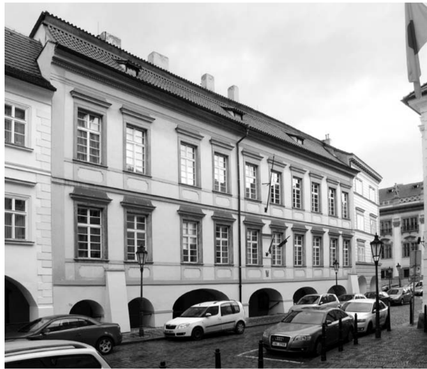
Palác Straků z Nedabylic, Maltézské náměstí 14, Praha 1 (vycházka 5. 2.)

Na vycházce si připomeneme bohatou historii kláštera s gotickými freskami, refektářem, Císařskou kaplí a kostelem Panny Marie, sv. Jeronýma a slovanských patronů. Následně navštívíme kostelík sv. Kosmy a Damiána Na Slovanech, který je dnes přizpůsoben byzantské-