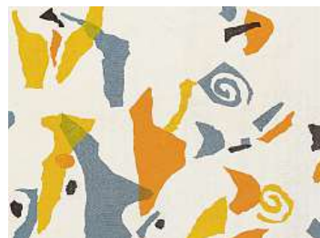
DÍLA „ZAVŘENÁ“ NA KAMPĚ DEKORAČNÍ TKANINA ÚBOK OD OLGY KARLÍKOVÉ Z VÝSTAVY V MUSEU KAMPA.