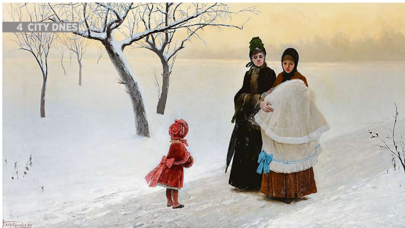
ZIMA PODLE SCHIKANEDERA OBRAZ JAKUBA SCHIKANEDERA ZIMNÍ KVĚT Z ROKU 1887 SE NA ŘÍJNOVÉ AUKCI V AUKČNÍ SÍNĚ ADOLF LOOS APARTMENT AND GALLERY VYDRAŽIL ZA 8 349 000 KORUN. DÍLO TROJNÁSOBNĚ PŘEKONALO SVOJI VYVOLÁVACÍ CENU.