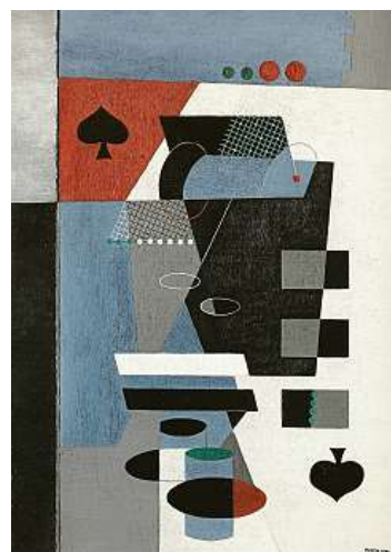
ČESKÝ REKORD PIKOVÁ DÁMA OD TOYEN SE PRODALA ZA VÍCE NEŽ 78 MILIONŮ.

Přestože se aukce přesouvají do online prostoru, zájem o ně se nijak nezmenšuje. Naopak. „Zájem je opravdu velký.