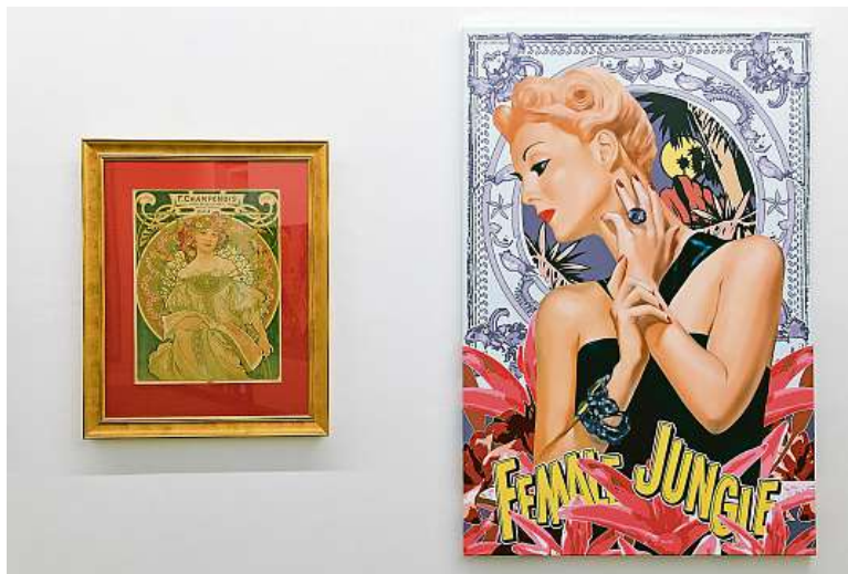
SPOJENÍ NESPOJITELNÝCH NA NEOTŘELOU VÝSTAVU DĚL ALFONSE MUCHY A SOUČASNÉHO UMĚLCE PASTY ONERA SE LEPÍ SMŮLA. NEJPRVE JI ZNEPŘÍSTUPNÍ POŽÁR V BUDOVĚ MUSEA KAMPA A NYNÍ KORONAVIROVÉ RESTRIKCE.