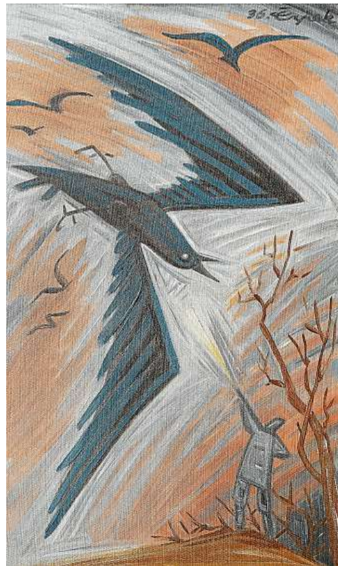
STŘELENÁ VRÁNA VRÁNA OD JOSEFA ČAPKA PADÁ K ZEMI, CENY JEHO DĚL NIKOLIV. TAKÉ TENTO OBRAZ JDE DO PODZIMNÍ DRAŽBY GALERIE KODL.

„Protože je teď vlastně více času na přípravu, může být naopak budoucí výstava ještě rozsáhlejší a zajímavější. Věřím, že se jí podaří uspořádat v příštím roce,“ doufá Hejtmánek.