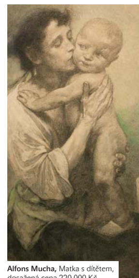
Alfons Mucha, Matka s dítětem, dosažená cena 220 000 Kč