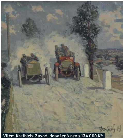
Vilém Kreibich: Závod, dosažená cena 134 000 Kč